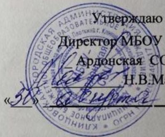
График работы школьного спортивного клуба «ЮНИОР» на 2021-2022 учебный год.